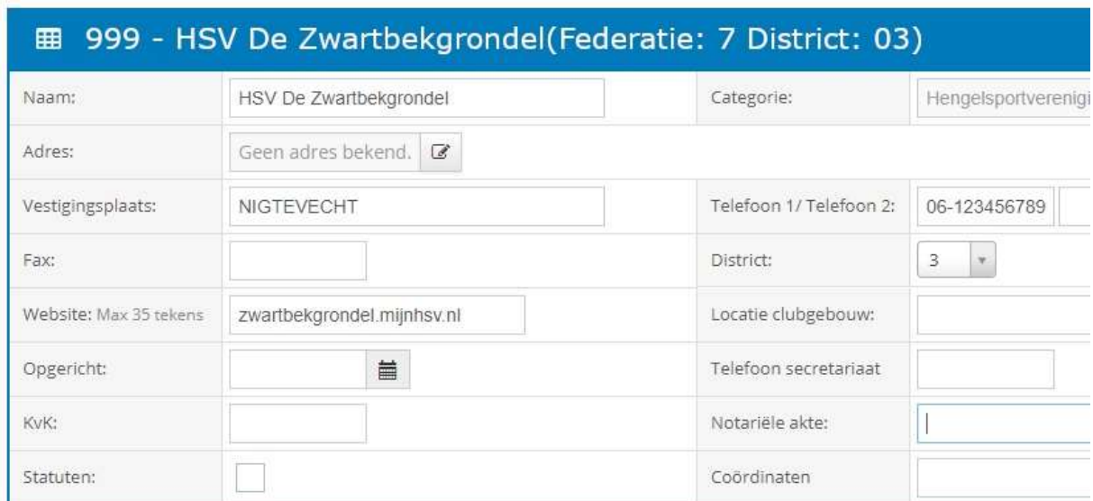
Afbeelding 5 : Verenigingsgegevens in HSV Leden

Onder details treft u de functionaliteit 'Rekeningnummers' aan. U dient hier de IBAN in te vullen van uw vereniging. Let op! De binnengekomen contributies worden maandelijks doorgestort naar het IBAN dat is opgeslagen als het type VOB . Als er geen IBAN bekend is, dan kunnen wij uw vereniging niet uitbetalen.