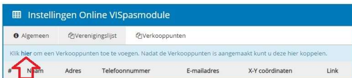
Afbeelding 8: Verkooppunt toevoegen (1)

Om een verkooppunt toe te voegen klikt u op het woord "HIER" in het scherm "Systeemfuncties" -> "Instellingen" -> "Modules" -> "Online VISpas module" -> "Verenigingslijst".