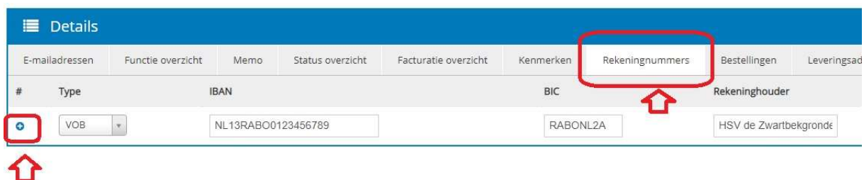
Afbeelding 6: VOB IBAN van uw vereniging toevoegen

Onder details treft u de functionaliteit 'Rekeningnummers' aan. U dient hier de IBAN in te vullen van uw vereniging. Let op! De binnengekomen contributies worden maandelijks doorgestort naar het IBAN dat is opgeslagen als het type VOB . Als er geen IBAN bekend is, dan kunnen wij uw vereniging niet uitbetalen.