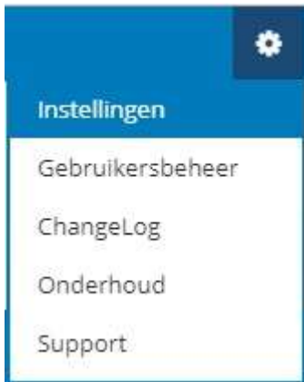
Afbeelding 1: Systeemfuncties -> Instellingen

Vervolgens komt het volgende scherm naar voren: